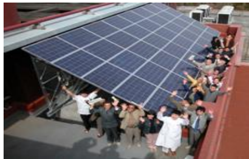
第1号市民共同発電所の前にて

これらを整理し新たな提言として、くまもと未来ネットでは、これまでに4回にわたりまとめて来た提言（Glocal Agenda）の更新再販を目指して、フォーラムやワークショップ等開催して行きます。そのための事業費集めにどうぞ、ご協力下さいませ！