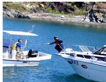
安全啓発パンフレット配布の様子

隊員は、小型船舶免許はもとより、海上安全指導員、看護師、海上特殊無線技士、アマチュア無線技士、工事作業の警戒船業務・管理講習受講者、スクーパー、潜水士等の資格保有者が多数在籍し、日々研鑽しています。