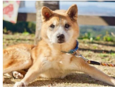
日向ぼっこ きずなの丘にて

より多くの方に私達の活動を知ってもらい、動物愛護について考えるきっかけとなってくれることを願います。