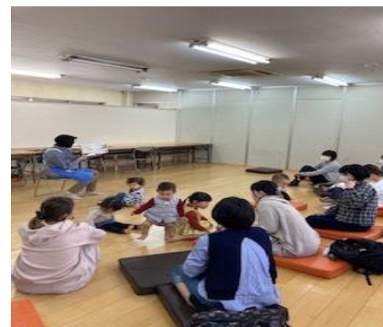
おはなしの世界を楽しむ親子

ペペペらんは、宇宙船の名前です。子どもたちをのせて、おはなしの世界へ飛び立ちます。