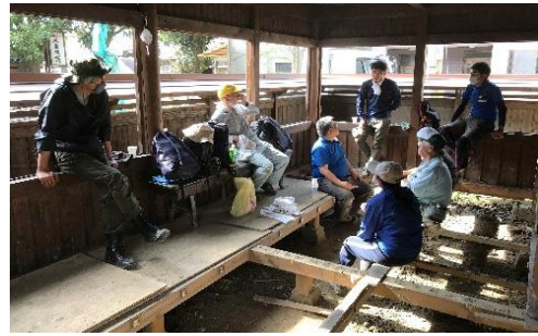
2020年9月23日 人吉旅館のボランティア活動