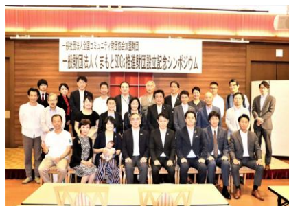
設立シンポジウムにて

地域の課題解決のための資金循環。そして、熊本に必要な、熊本らしいその仕組みづくりにご協力、ご賛同のほど何卒よろしくお願いいたします。