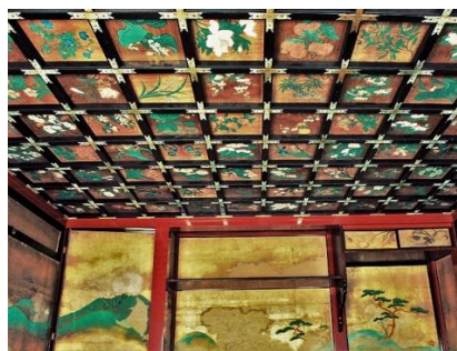
波奈之丸(なみなしまる)内部・天井画

ふるさとを想う皆さまのご支援を、後世に繋がる新たな文化財として、また、熊本城天守閣の復旧にも花を添えられるような展覧会を実現させたいと願っています。どうぞ宜しくお願いいたします。