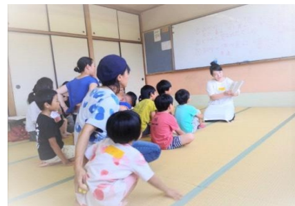
親子対象性教育講座の風景

その他、性的問題を抱える子どもたちの治療プログラムにも参加し、その中で見えてきた社会的課題にも目を向け、時代やニーズに合った【いのちの学び】を届けています。誰ひとり性犯罪の当事者にしない!という強い思いのなかで、行政や学校と連携をとりながら活動を広めていきます。