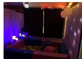
部屋の様子 スヌーズレン