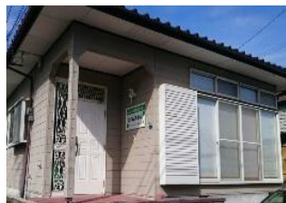
施設：エイムズ小山

当法人は、熊本市東区で重症心身障がい児を対象とした通所支援事業（児童発達支援事業・放課後等デイサービス事業）、また相談支援事業を展開しています。看護師による医療的ケア（服薬管理や体調管理等）や機能訓練担当職員によるハビリテーションを行い、生活面や余暇活動のサポートを行っています。特にスヌーズレンやコミュニケーションツールの活用に力を入れており、関係機関と連携を取りながら障がいのある方の社会参加を支援しています。