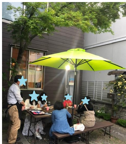
ある日の食事風景