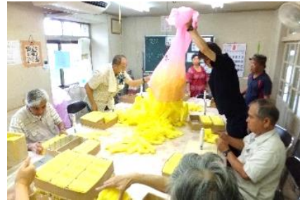
フルーツキャップの 袋詰め作業の様子

市からの地域活動支援センター事業委託費のみでの運営が厳しいので、ご支援をお願いします。