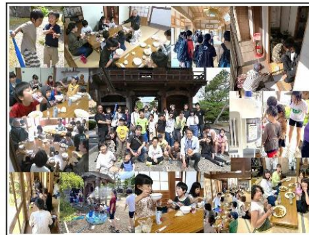
人吉災害支援活動の子どもたちの様子

各地区にこれからも子どもたちの居場所を創っていきたいと考えています。どうか、みなさまのご協力をお願いします。