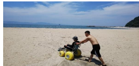
砂浜用車いす支援の様子

ご寄付頂いた資金は県内の様々な観光地のUD情報を取材、発信するために大切にに使わせていただきます。