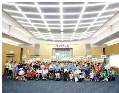
『特別支援学校・学級、スペシャルオリンピックスの皆さん対象のボッチャ大会「楽球甲子園」に参加した皆さん』

その他、障がい者及び障がい者の芸術やスポーツ活動を知っていただくために、フォーラムやトークショーを不定期に開催したり、芸術やスポーツ活動に取り組む団体の支援をしています。