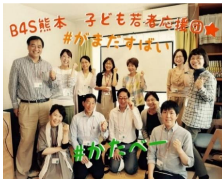
居場所かたるベースくまもとにて、 スタッフ、ボランティア大募集！

これからも社会的養護下の子どもたちにより良い支援を行うため、それぞれの特長・専門性を持つ社会資源にも積極的に橋渡し（ブリッジ）し、子どもたちがどんな環境で生まれ育っても、夢と希望を持って笑顔（スマイル）で暮らせる社会を目指して活動してまいります。