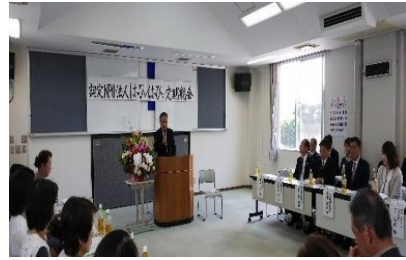
大津・菊陽町長、合志市長参列の総会の様子

幸せさがしに出会いの場を提供し、婚活の手助けを12年間にわたり活動。公益性が高い団体とする熊本県の認定NPO法人として、少子化対策及び高齢者福祉に一役。登録制により、婚活（若者、ミドル、シニア）パーティー、ファイル閲覧、紹介見合いを定期的に開催中。