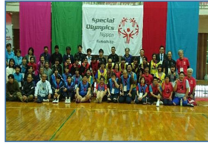
バスケットボール地区大会の様子

SOはスポーツ活動を通して知的障がいのある人たちが地域で生き生きと暮らしていける社会を目指しています。熊本県内各地域（ブランチ）でも活動しています。